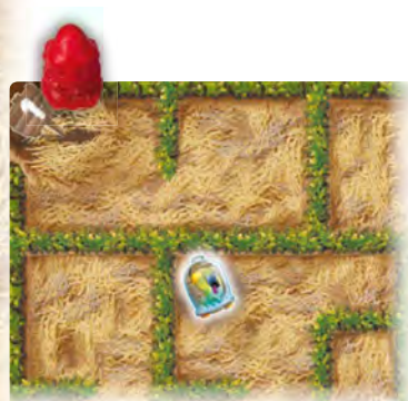
Первая сторона игрового поля А

Когда вы передвигаете одного пришельца, второй перемещается вместе с ним! Каждый игрок управляет только одним из пришельцев. Игроки передвигают фигурки по очереди. Порядок хода не имеет значения: каждый игрок может передвинуть фигурку своего пришельца в любой момент. Именно поэтому так важно переговариваться в процессе игры, чтобы проложить как можно более короткий путь до нужного предмета!