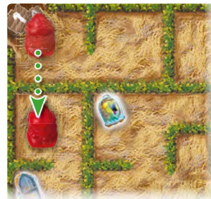
Первая сторона игрового поля А

Пример: Таури передвигается по лабиринту вниз. Одновременно на другой стороне поля Мино проходит сквозь заросли кукурузы.