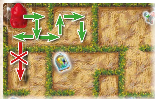
Первая сторона игрового поля А

Пока другой игрок передвигает пришельца на не видимой для вас стороне поля, старайтесь не придерживать фигурку своего пришельца.