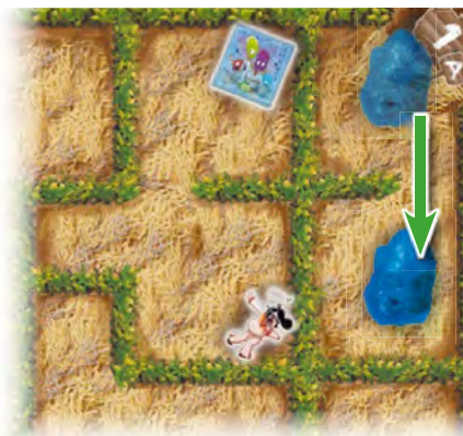
Вторая сторона игрового поля А

На каждой стороне игрового поля изображён большой лабиринт. Вы можете передвигать фигурку пришельца только по тропинкам внутри обращённого к вам лабиринта. Заросли кукурузы являются препятствиями, и проходить сквозь них нельзя. Лабиринты на двух сторонах поля различаются. Например, если вы переместите фигурку Таури по тропинке вниз, то Мино невольно переместится через заросли кукурузы (смотрите рисунок). Таким образом, Мино сможет попасть в те части лабиринта, которые изначально были для него недоступны.